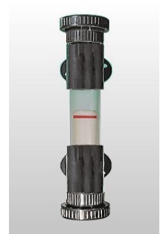
KNR PVC 63E