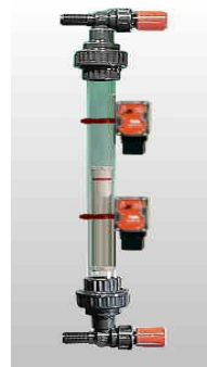
KNR PVC 32E